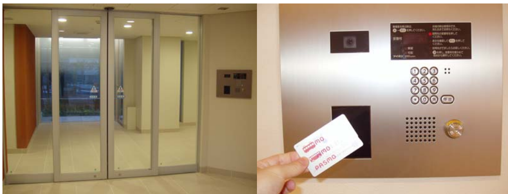
【エントランス前集合玄関機と一体化になったカードリーダー】

専用のカードリーダーはエントランスの集合玄関機に組み込まれ、居住者の日常の導線上に設置されています。最寄駅の改札を PASMO・Suica で通過し、そのまま同じカードを手に持ち、エントランスを通過することが出来るといった、スマートなマンションライフスタイルを実現しています。