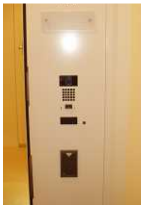
専有部設置のカードリーダー