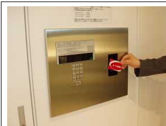
集合玄関機と一体型になったカードリーダー