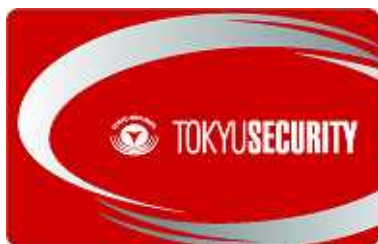
【東急セキュリティオリジナル専用ICカード】

共用部には2重のセキュリティライン(高層フロアのプレミアム住戸階は3重)が構築され、専有部玄関と合わせて複数のセキュリティラインを全てICカードで制御します。更に共用部・専有部での様々な連動機能により、高セキュリティレベル且つスマートなマンションライフスタイルを可能にしています。