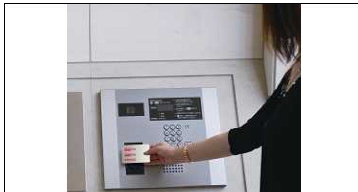
集合玄関機と一体型に なったカードリーダー（イメージ）

「PASMO」「Suica」の裏面に記載された「17桁のカード番号」が分かれば、マンションキーとして登録することが可能です。従来はご入居者様本人が登録したいカード本体を持って、決められた時間に管理室等に向かわなければならない、更に管理室内等に設置された専用リーダーでの読み込みが必要といったような煩わしさがありましたが、本システムは所定の申請用紙等にカード番号をご記入・ご提出頂くだけで登録することが出来ます。