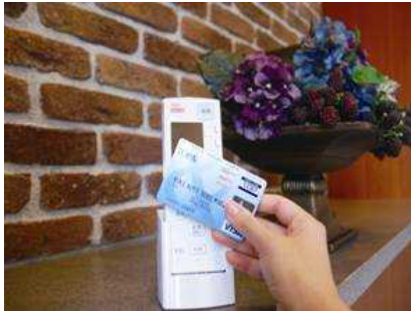
ホームセキュリティ端末の操作イメージ