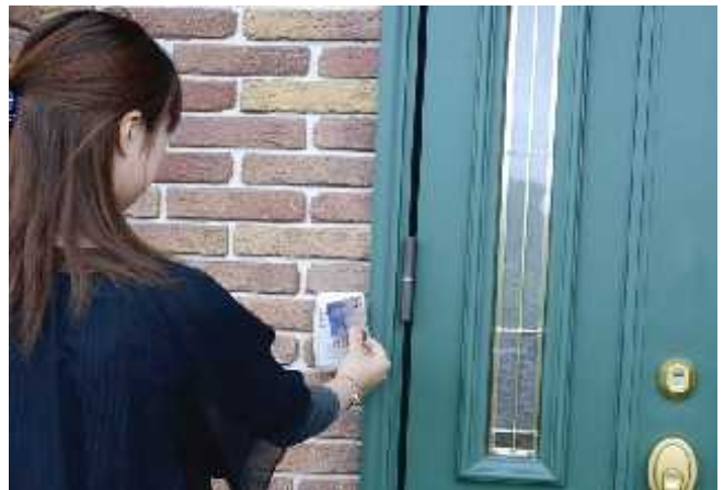
玄関に設置された非接触型 IC カードリーダーの操作イメージ