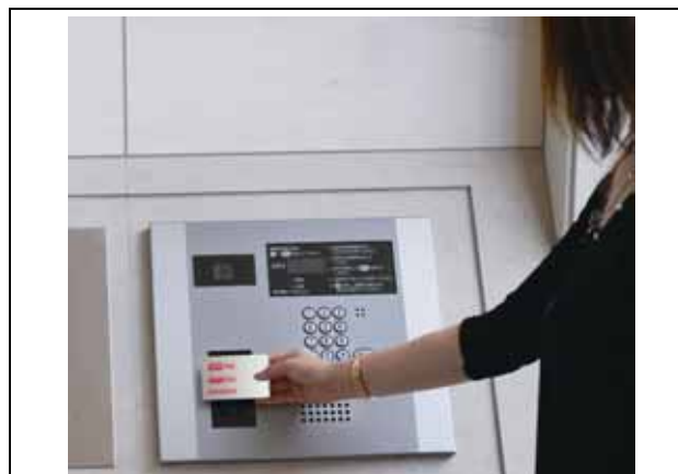
集合玄関機と一体型になったカードリーダー(イメージ)