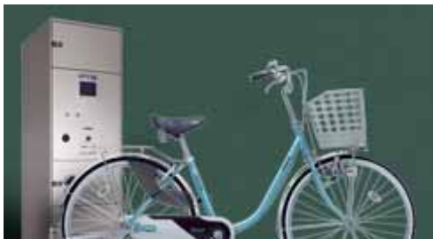
電動アシスト付レンタサイクル(イメージ)