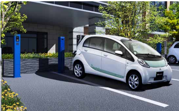
電気自動車充電機（イメージ）

株式会社サンケイビル様「ルフォン青葉市が尾」（2011年度末竣工予定）に電気自動車充電機連動機能が、東京急行電鉄株式会社「ドレッセ鷺沼の杜」（2013年度竣工予定）に電動アシスト付レンタサイクル連動機能が、それぞれ導入される予定です。