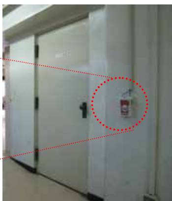
写真：文教大学付属小学校設置の様子