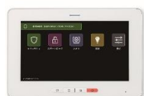
タッチスクリーン